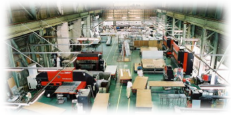
工場内製造機器の状態監視