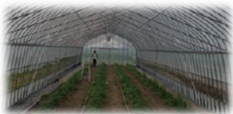
野菜工場や倉庫の温湿度管理